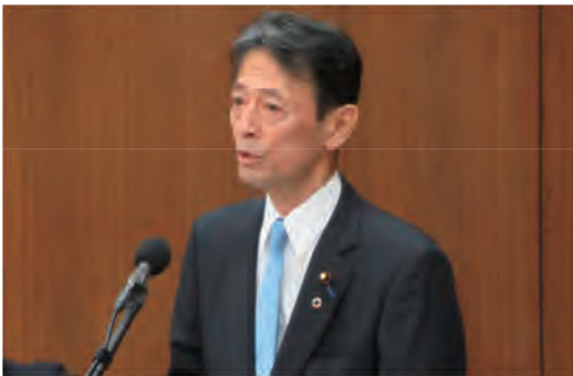
◆ 4月23日 衆議院・国土交通委員会にて質問