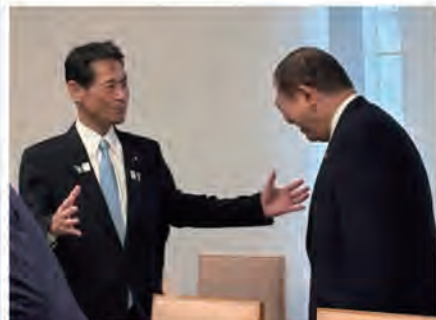
◆4月24日 首相官邸にて アジア・アジアパラ競技大会要望を行う

また、4月には国土交通委員会において、地元名古屋市に関する「名古屋高速道路最高速度の見直し」などを